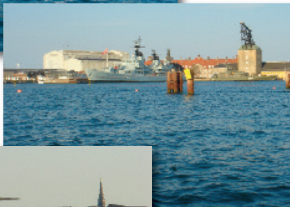
Museumsskibet Fregatten Peder Skram og maste-kranen på Holmen.