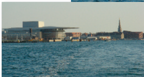
Operaen i København og Vor Frelsers Kirkes tårn.