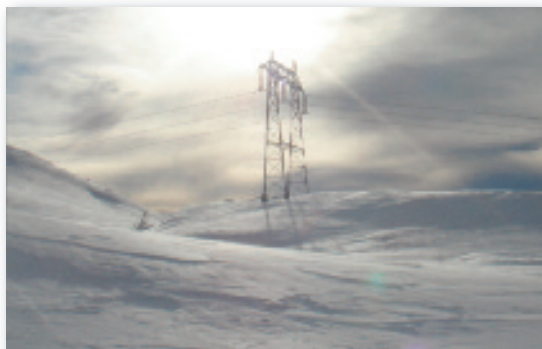
Bekendt stålmaster ved Bingsbu

Men hvor kommer masterne egentlig fra, og hvor fører de hen? - Dog først: Ca. 99% af al den elektriske energi, der produceres i Norge, er produceret på basis af vandkraft. Ganske imponerende. Set i det perspektiv spiller den venlige vildmark omkring Ruten Fjellstue en ganske interessant og vigtig rolle. De nævnte master kommer nemlig principielt fra Øvre Vinstra Kraftverk, som ligger nede ved søen Slangen. Kraftværket kommer man hurtigt til, når man kører ad vejen mod Sikildalsseter (skiltet).