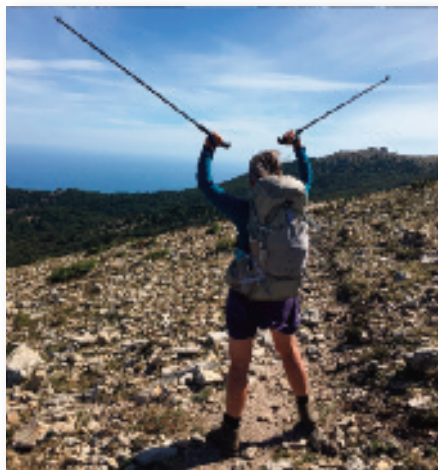
Sofie skimter Middelhavet

GR10 kræver også koncentration og mod. Farer lurer hver eneste dag, og et enkelt forkert skridt ud af de i alt 1,5 millioner skridt, vi hver tager på sådan en tur, kan sende os hjem eller endnu værre - ned!