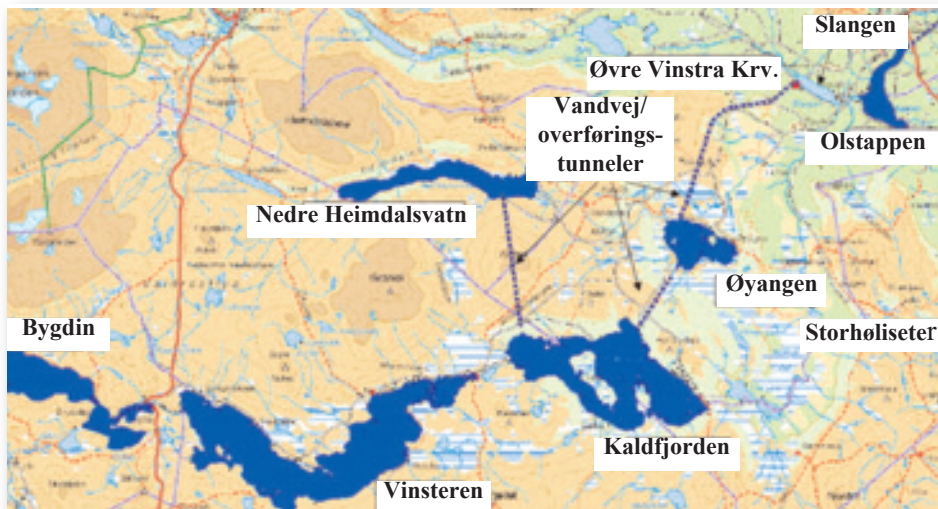
Oversigtskort over anlæggene til vandkraftproduktion i 'Vinstravassdraget'

Her er så lidt sammenhænge at fundere over, næste gang du tager stærkstrømsløjpen op til Bingsbu, eller du fra Ruten Fjellstue ser over på stålmasterne på den anden side af Breidsjøen. - Forhåbentlig var denne historie ikke alt for kompliceret.