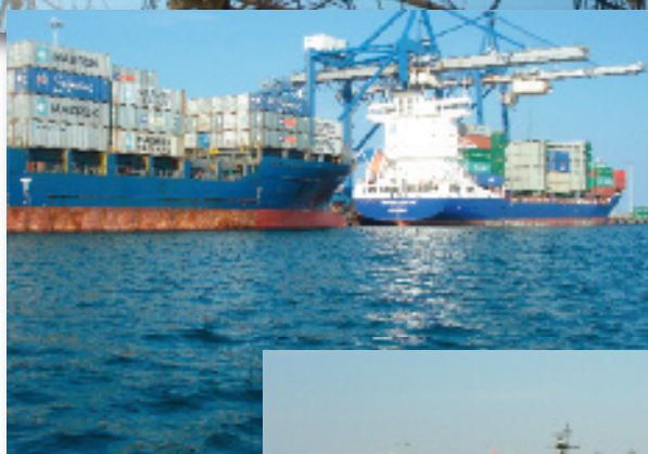
Masteakrobatik på sejlskibet Georg Stage og et par feeder-skibe med containere.