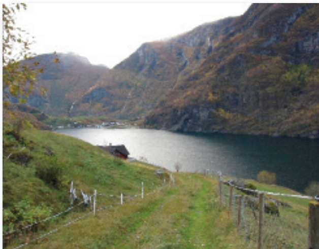
Udsigt mod Flåm