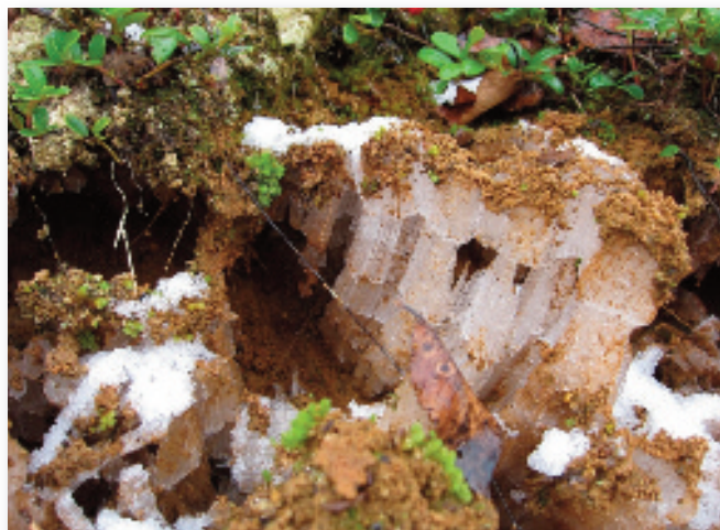
Sylespidse nåle af is = nålis

øverste finkornede jordlag opad. Det kan ske, når den første nattefrost kommer, og det frosne jordlag trækker fugt fra jorden nedenunder op. Isen vokser sig flere centimeter tyk, og som et tyndt tæppe ligger jorden henover. Man kalder det også ”pibegrave”. Så blev vi så kloge!