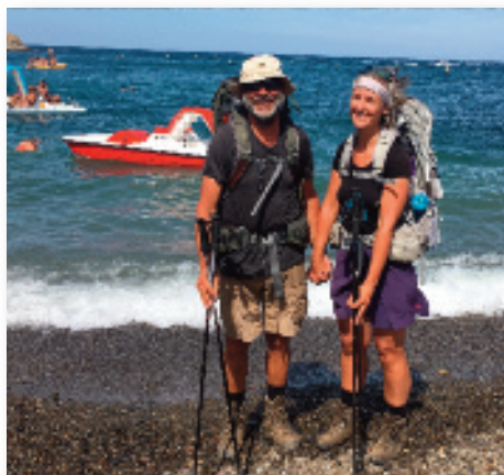
Endelig fremme ved Middelhavet

armene, for drømmer vi eller er vi vågne?