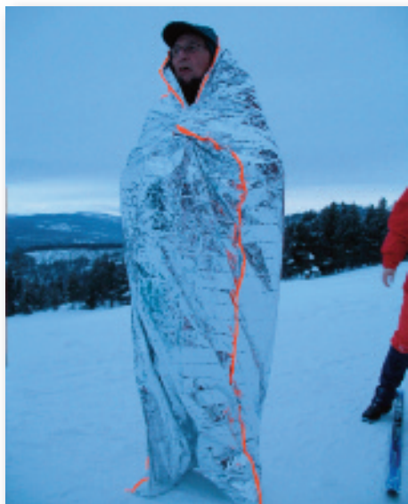
Finn forklædt som astronaut

dette er der levende berettet om i Ski-klubbens blad nr. 22 og nr. 30.