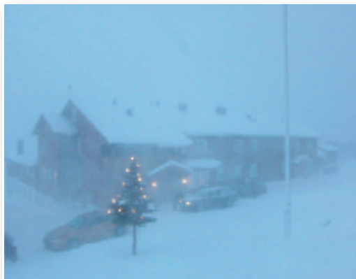
Storm over Ruten Fjellstue i uge 4

Forleden tog vi snesko på og gik ned for at se på det ny byggeri. Elgtårnet kan ses oppe fra fjellstuen, så vi kendte retningen. Det er i store træk nedad og lidt til højre. Men det forsvinder hurtigt fra synsfeltet, når træerne tager udsynet. Vi fandt det dog uden at lede ret længe. Skelettet til bygningen er rejst, og det ser godt og gedigent ud. Det bliver spæn-