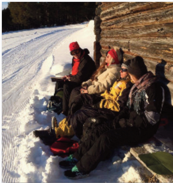
Hygge ved skistalden

stalden, smører efter alle kunstens regler og så afsted ... Og så falder der ro på, og jeg tager ud på snesko med mit kamera i lommen og lykke i sjælen. Til frokost får vi opdatering på, hvordan det gik. Var der snefygning? For meget modvind på Hattdalseter? Havde det alligevel været bedre den anden vej? Smøringerne er også altid spændende. Der diskuteres livligt, hvilken farve swix, der duer?