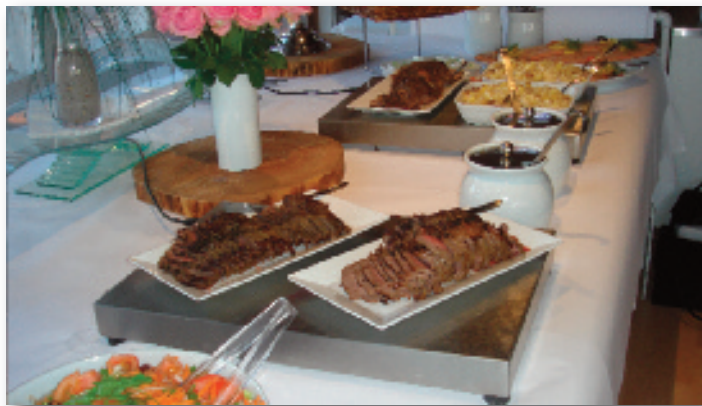
Udsnit af den lækre buffet

Medlemstallet er for opadgående. I 2015 var der 56 medlemskaber, i 2016 er der 60 medlemskaber.