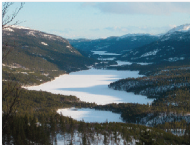
Espedalens søer på rad og række