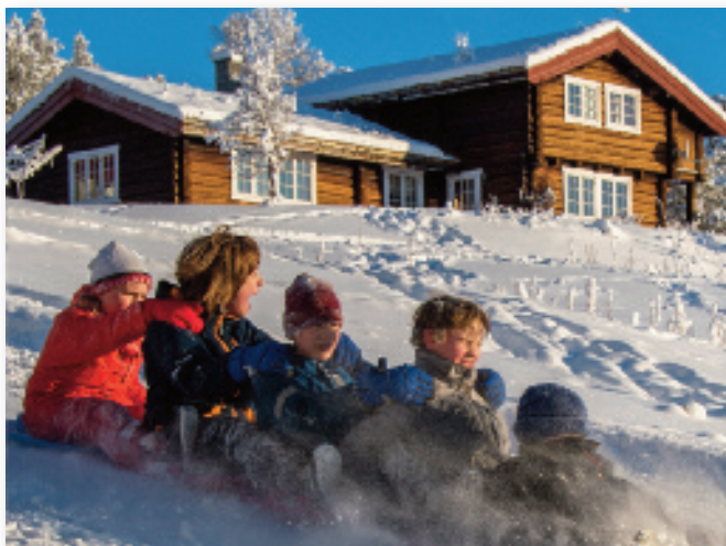
Børn i herlig vinterleg

Vi prøver hele tiden å promotere januar også, som er en fantastisk måned med gode sneforhold og ofte stabilt vær. Selv om dagene er kortere enn i februar, er lyset vi har i januar en opplevelse i seg selv. Og solen har vi jo hver dag her oppe,