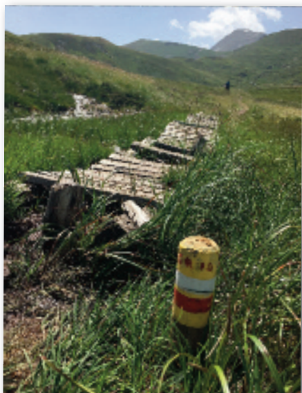
Vandresti på GR10 og ditto mærkningspæl